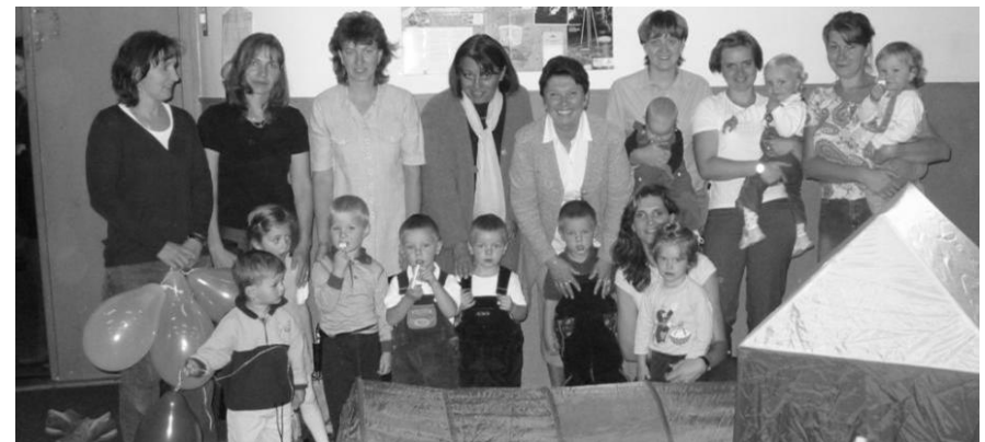
Foto: Zahájení činnosti v DDM Benešov , říjen 2003.

Od roku 2005 je MC Hvězdička členem Sítě pro rodinu (dříve Sít' Mateřských center).