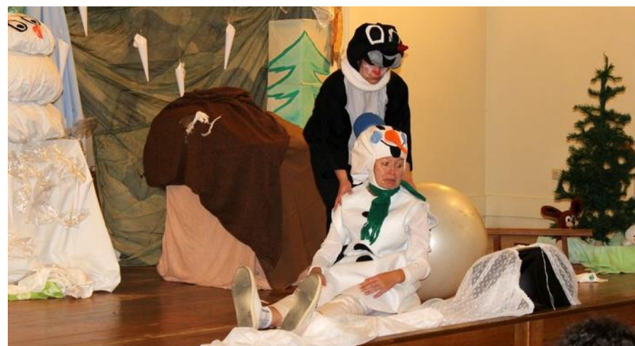
Půlhodinky s pohádkou pro nejmenší