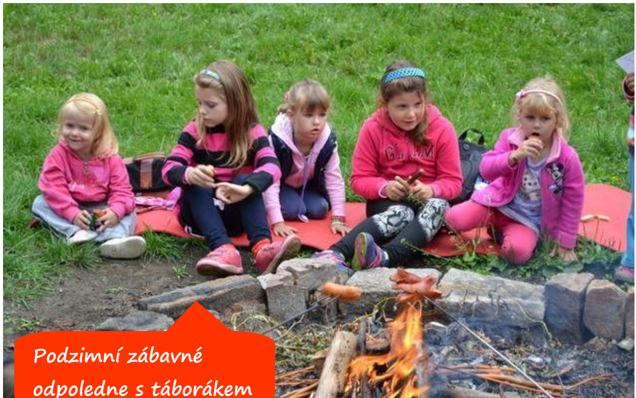
Podzimní zábavné odpoledne s táborákem