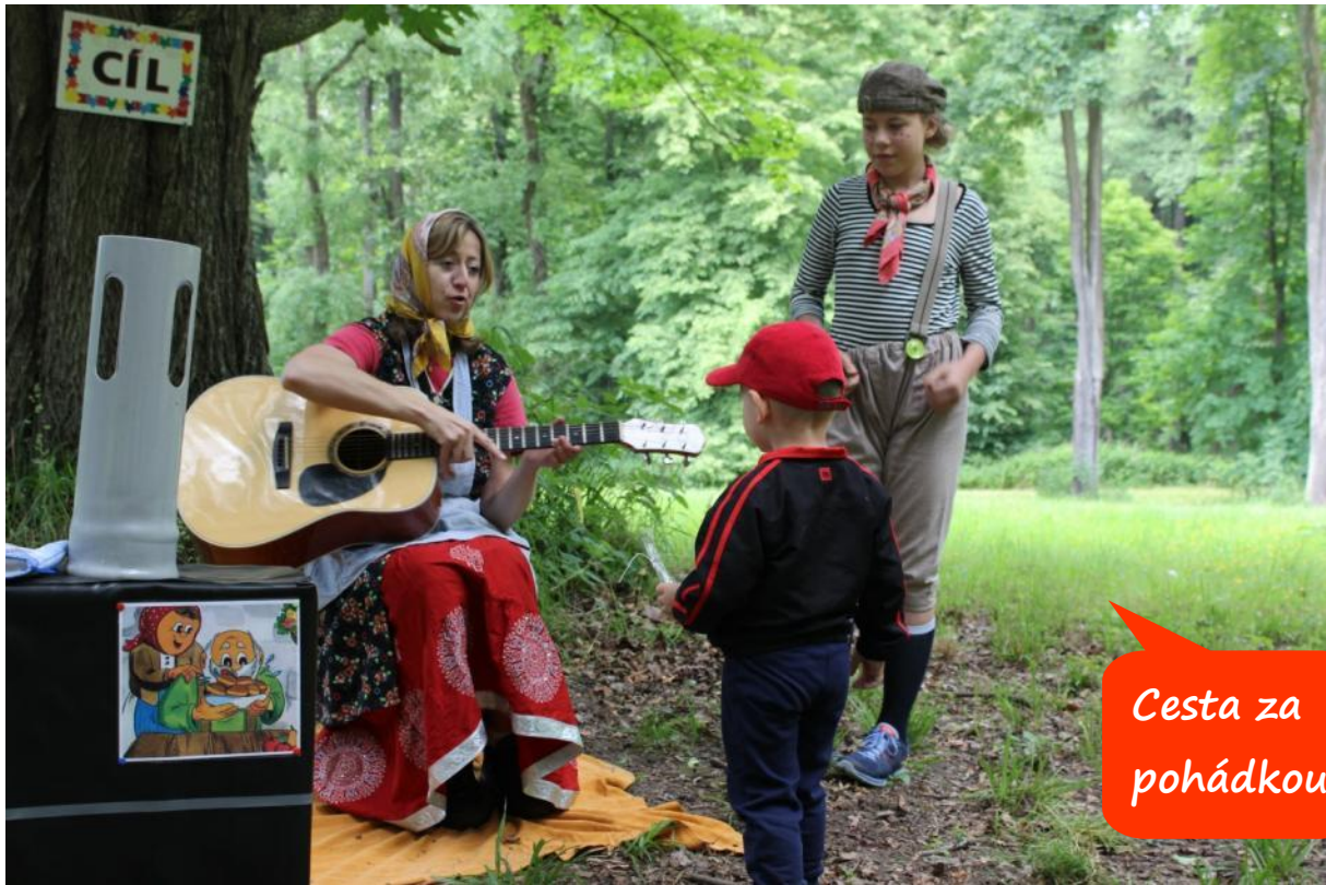
Cesta za pohádkou