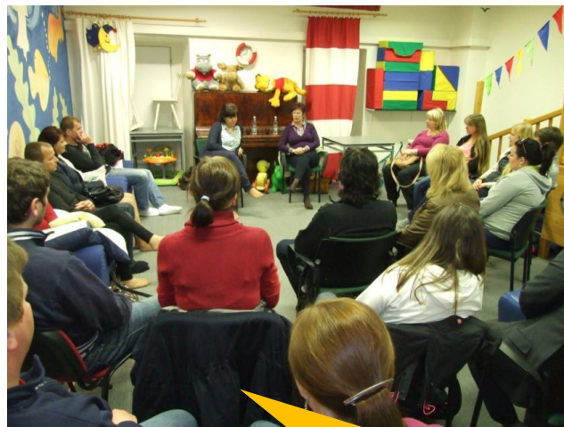
Přednáška příprava k porodu.