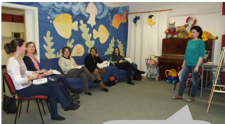
Kurz Jak sladit péči o rodinu a dítě s pracovními povinnostmi.