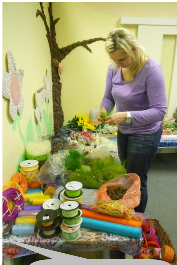
Velikonoční aranžmá a velikonoční tvořeníčko