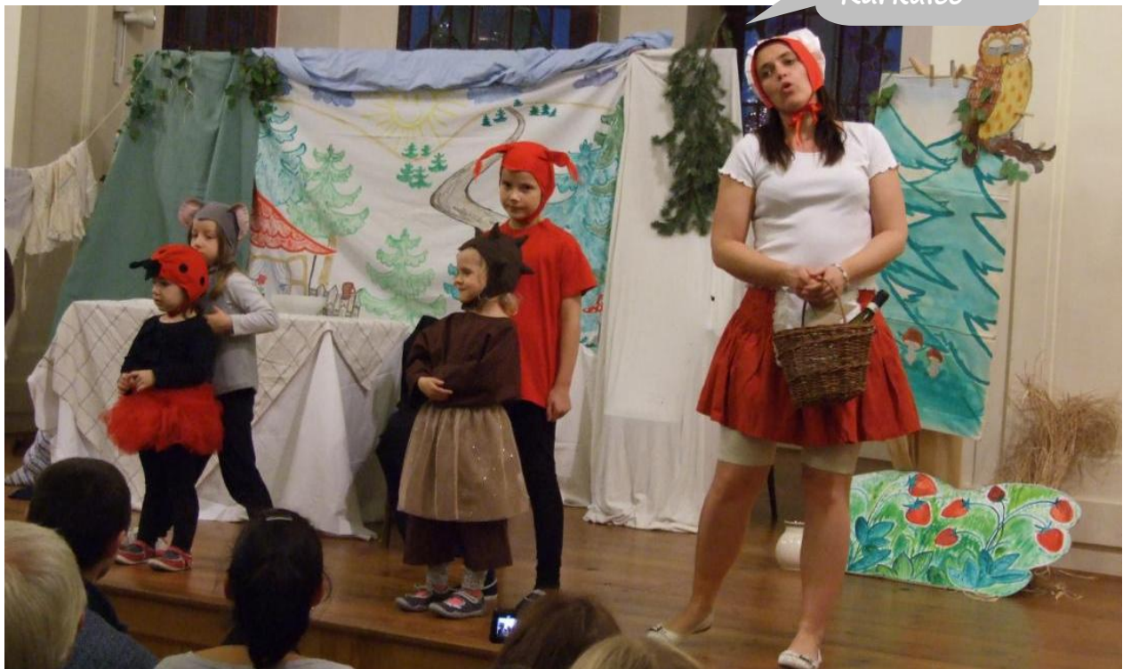
O Červené Karkulce