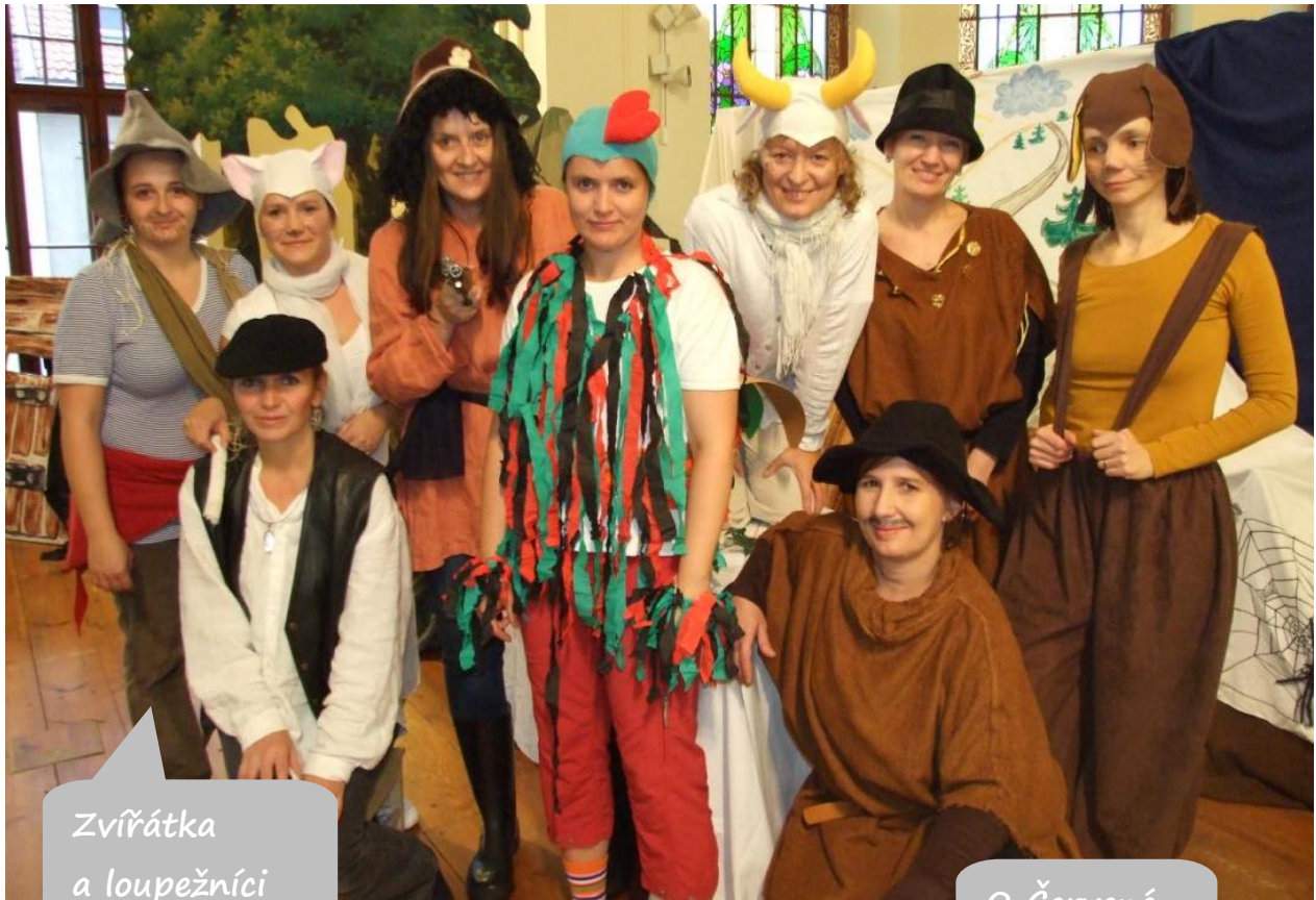
Zvířátka a loupežníci