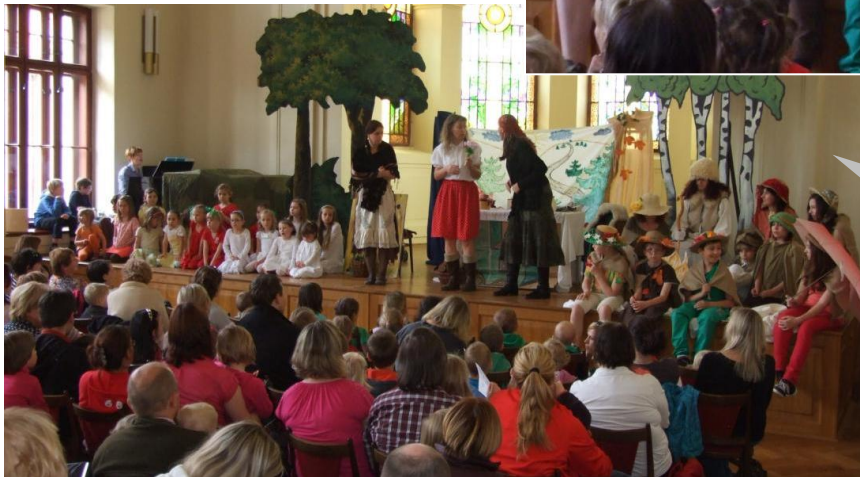
Pohádka o dvanácti měsíčkách