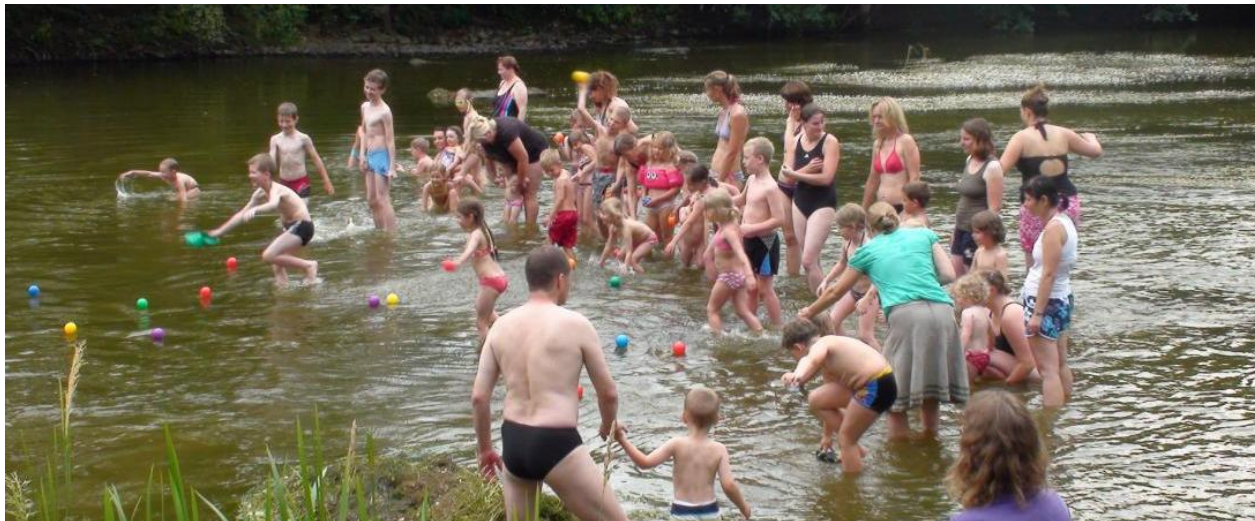
Letní tábor Soběšín