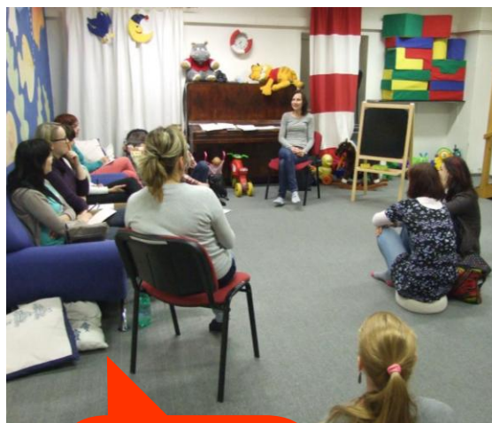
Beseda logopedická prevence, příprava dítěte na školu