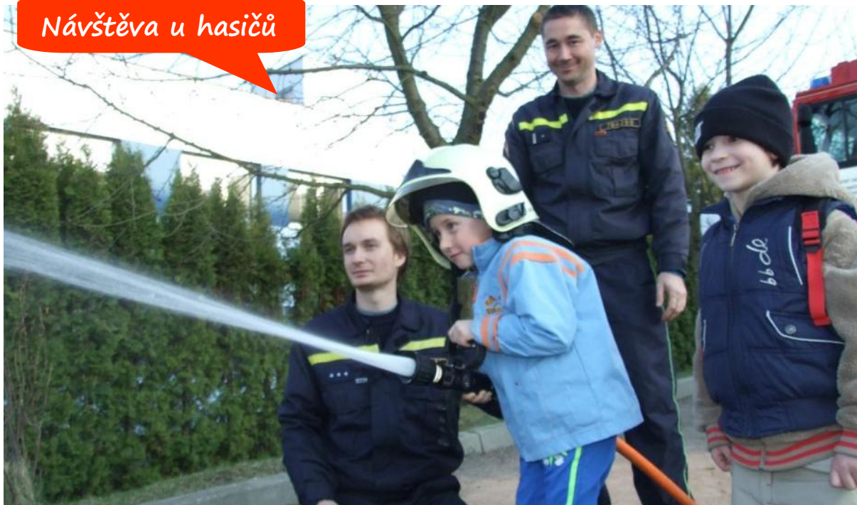
Návštěva u hasičů