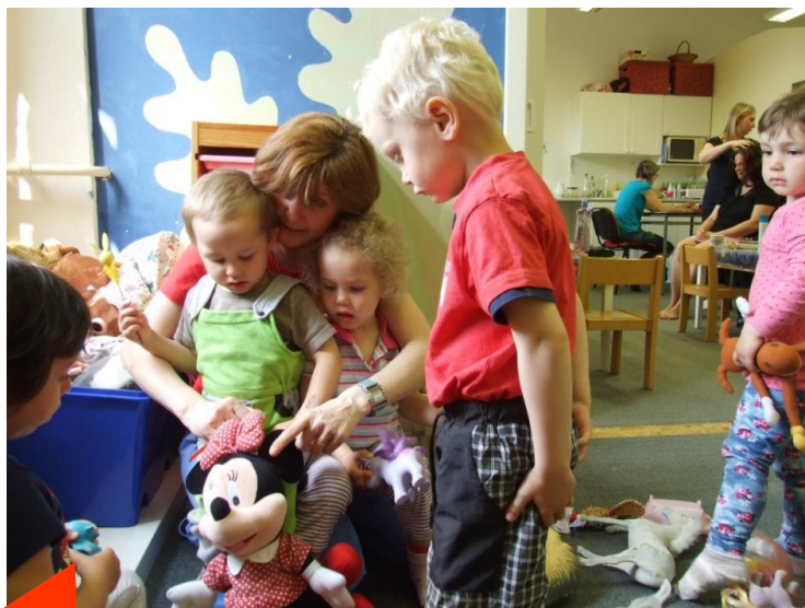
Den pro maminky (s hlídáním dětí)