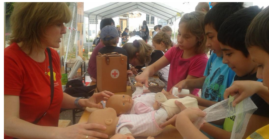
Foto: Atletika a atletické závody; Návštěva u hasičů; Spolupráce na Dni prevence (pořádalo Město Benešov)