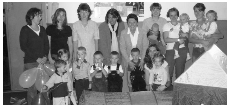
Foto: Zahájení činnosti v DDM Benešov , říjen 2003.

Od roku 2005 je MC Hvězdička členem Sítě pro rodinu (dříve Sít Mateřských center).