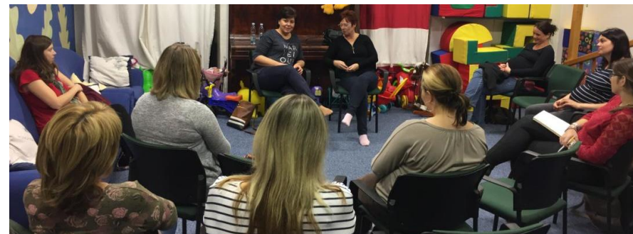
Foto: výše z přednášky – příprava k porodu, níže: kurz – jak se uplatnit na trhu práce