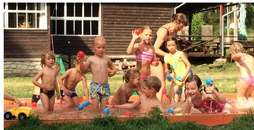
Foto: Lampiónový průvod v maskách; Cesta za pohádkou; Příměstský tábor se zvířátky; Pobytový tábor