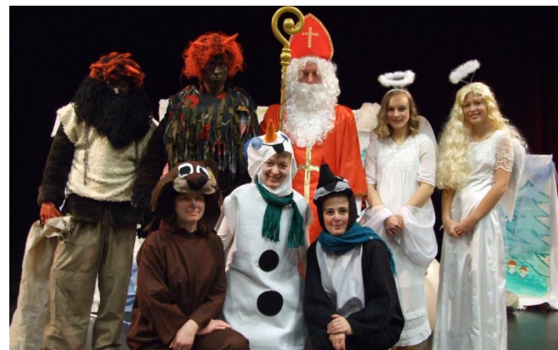
Foto: Flétnička a koncert; Zábavné odpoledne s táborákem; Cvičení miminek; Mikulášská besídka