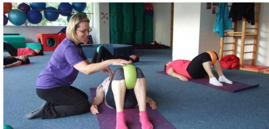
Foto: Velikonoční tvoření; Buď jedničkou s Hvězdičkou, Cvičení a besedy pro těhotné; Zdravotní cvičení.