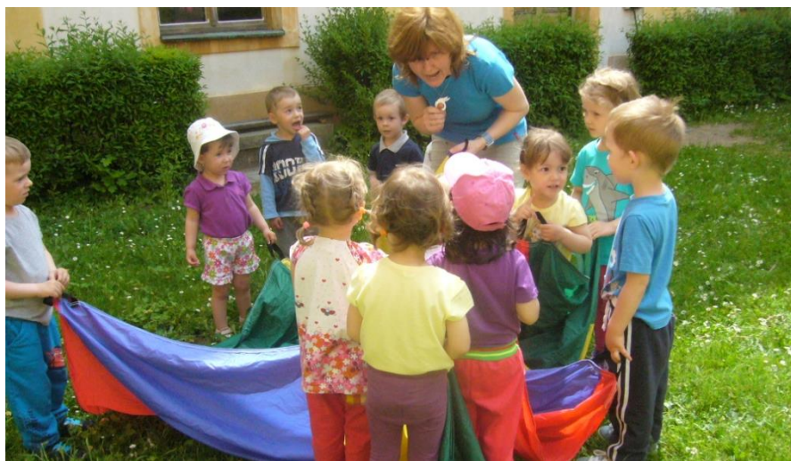
Foto: Minisportovky Školička s Hvězdičkou Cvičení dětí