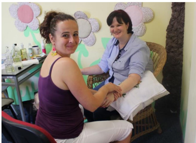
Den pro maminky