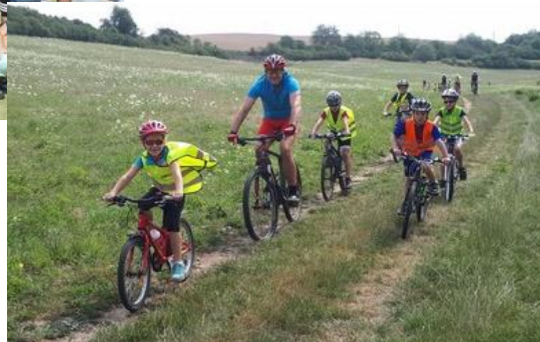
Příměstský sportovní tábor