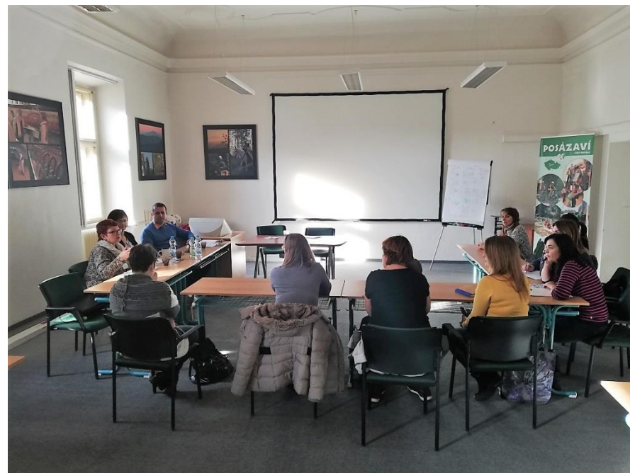
Besedy: Rodina si má pomáhat, Beseda s úřadem práce