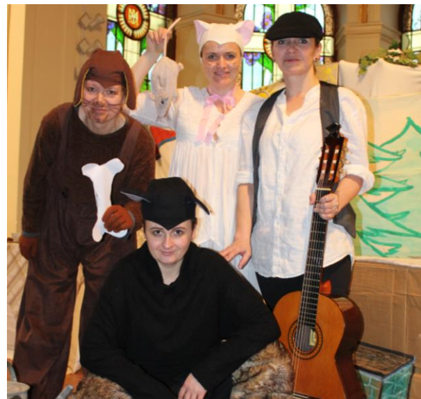
Pohádky: O veliké řepě, O Smolíčkovi, O pejskovi a kočičce