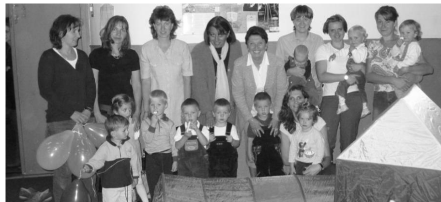
Foto: Zahájení činnosti v DDM Benešov , říjen 2003.

Od roku 2005 je MC Hvězdička členem Sítě pro rodinu (dříve Síť Mateřských center).