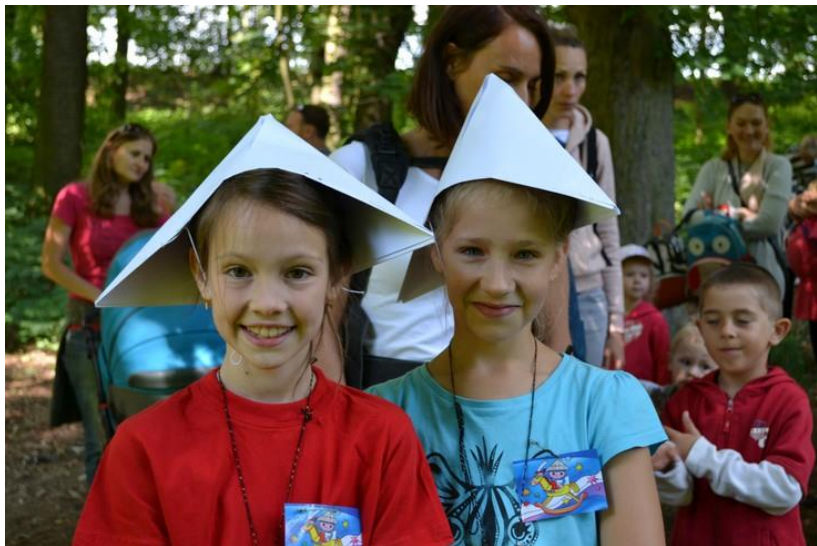
Cesta za pohádkou