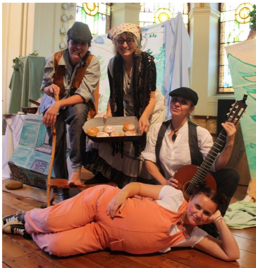
Pohádky: O Koblížkovi, O 12 měsíčkách, O Šípkové Růžence