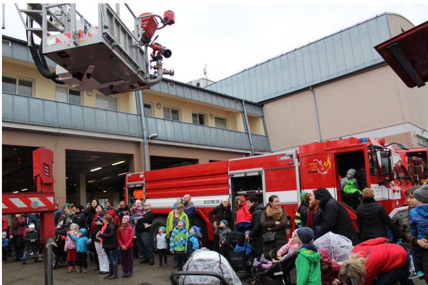
Návštěva u hasičů