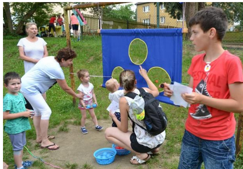
Sportovně zábavné odpoledne