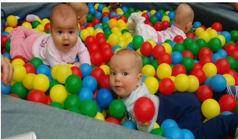
Cvičení miminka. Okinawské karate. Senior Fitness