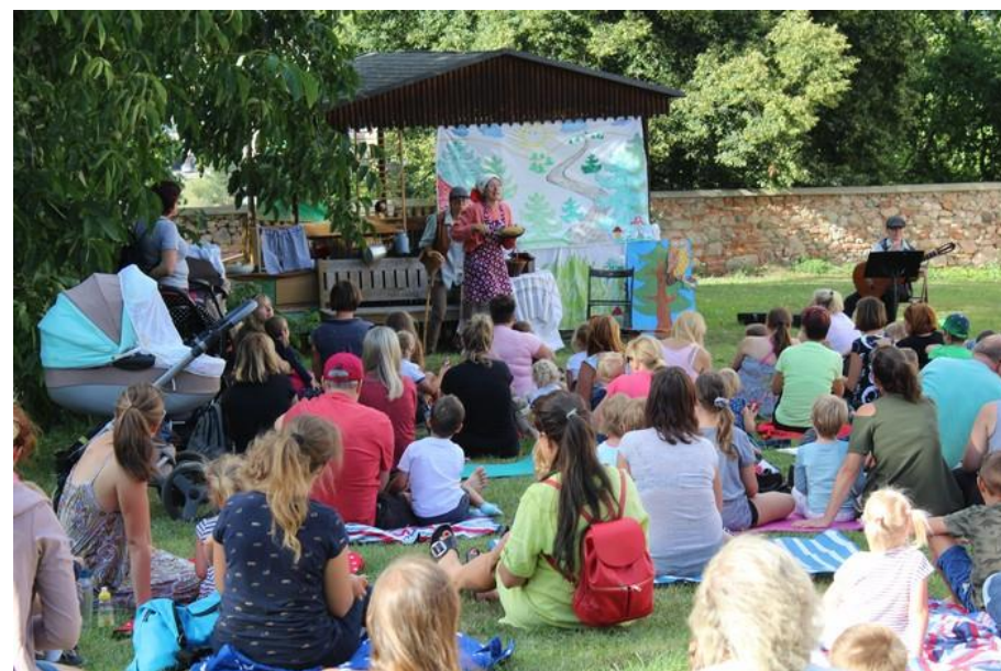
Benefiční pohádka O Koblížkovi na farní zahradě