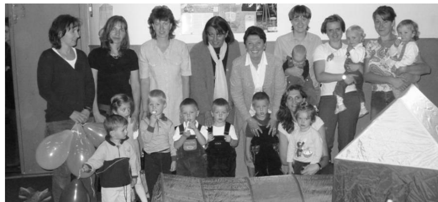
Foto: Zahájení činnosti v DDM Benešov , říjen 2003.

Od roku 2005 je MC Hvězdička členem Sítě pro rodinu (dříve Sít mateřských center).