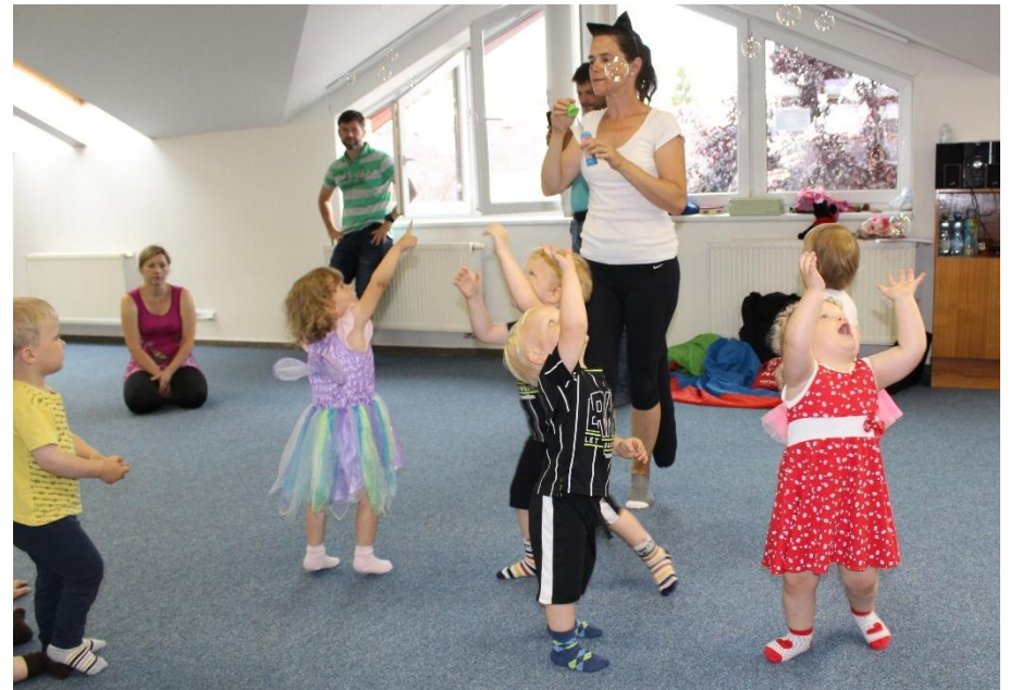
Zpívanky v tělocvičně