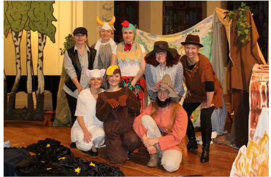
Půlhodinky s pohádkou pro nejmenší