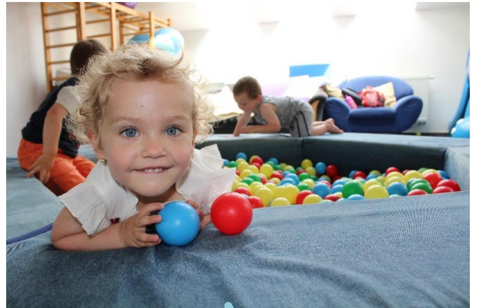
Cvičení dětí v tělocvičně