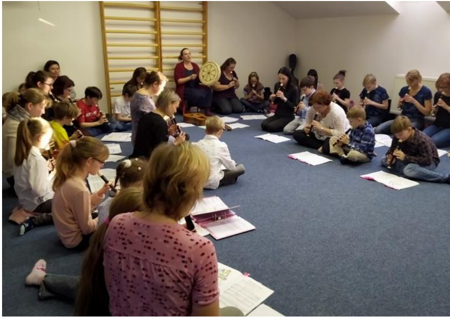
Tříkrálové flétnové koncerty