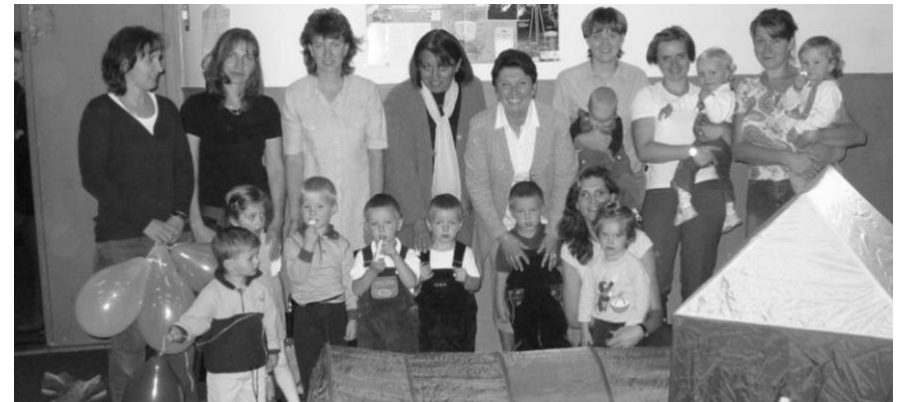
Foto: Zahájení činnosti v DDM Benešov , říjen 2003.

Od roku 2005 je MC Hvězdička členem Sítě pro rodinu (dříve Sít' Mateřských center).